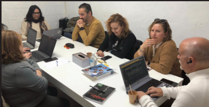
Primera reunión de directiva en 2024, el 14 de enero

La campaña de 21 días con sus 21 vídeos de #NoSomosRaros; la de #MujeresconVista por el Día de la Mujer; la grabación y emisión en La 7 del programa Corazón Solidario, con el café de Tina, la visita a la lona de Puebla con Puebla, la charla en el colegio Juan XXIII o la exposición de Emociones a la vista en el Colegio de Farmacéuticos que, después, trasladamos once días al centro comercial Nueva Condomina; tres días de charlas a un colegio entero en Alhama; la participación en la Feria de Voluntariado y en la del Libro de Lorca; nuestra asamblea general con el posterior almuerzo; la grabación, edición y publicación de tres episodios de Canal Retina; la asistencia a muchos actos en Murcia, Molina y Cartagena; la atención a numerosas entrevistas en radios como Onda Regional, Ser o Cope; y la edición de esta revista, que se queda cada vez más corta de espacio. Todo en apenas tres meses. Empezamos el 14 de enero y esto no hay quien lo pare.