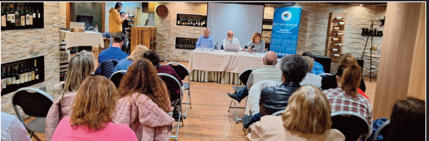
Imagen de la asamblea general de Retina Murcia en un salón del Hotel El Churra de Murcia

Aumenta la participación de socios en eventos y también su disposición a colaborar