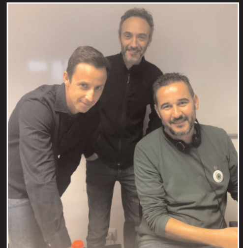
El equipo técnico de Canal Retina